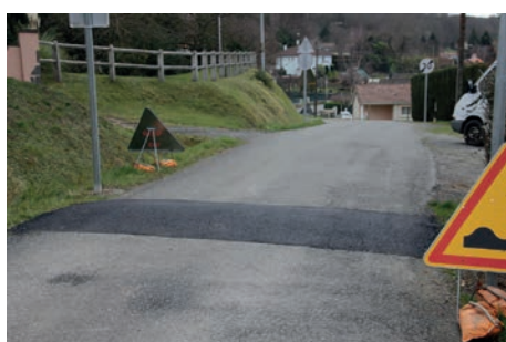
Ch. des Ecureuils sécurisation sortie riverains et les Fresne