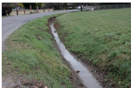
Av. de la Libération curage de fossé