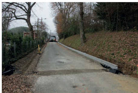
Avenue de l'Ousse début travaux