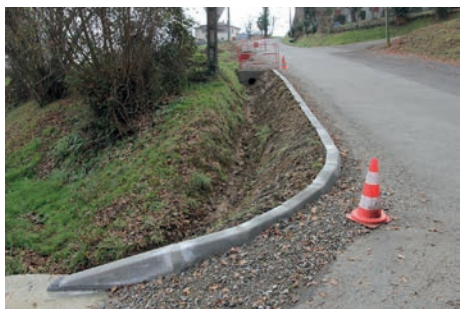
Avenue du Pic du Midi élargissement

Pour 2016 d'autres travaux vont être programmés toujours dans l'esprit d'améliorer le quotidien de nos administrés.