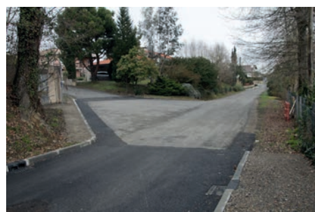
Av. de l'Ousse côté imp. des Mélézes