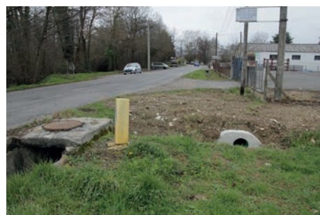
Av. de la Libération busage fossé