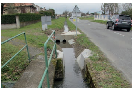
Av. de la Libération curage fossé et ouvrage bétonné