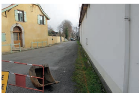
Av. de l'Ousse avant travaux