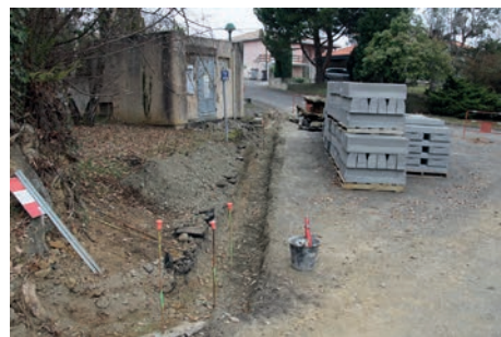
Intersection Impasse des Mélézes/Av. de l'Ousse