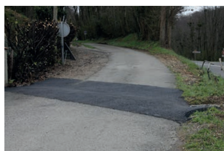
Busage fossé Ch. des Chevreuils