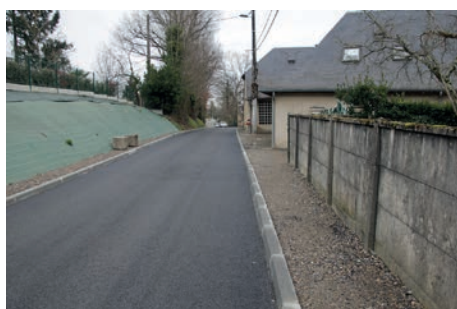
Av. de l'Ousse partie centrale