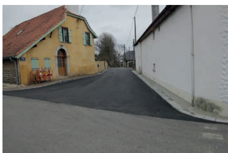
Av. de l'Ousse côté Av. Palomières