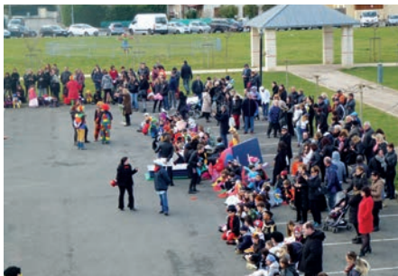
Parents et Grands-parents participatifs