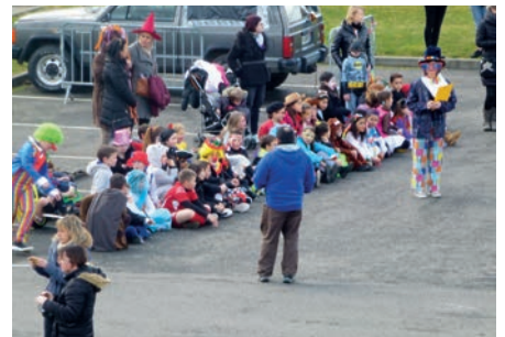
Patients avant d'agir