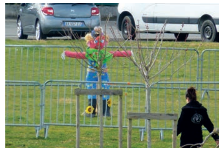
La sentence se prépare