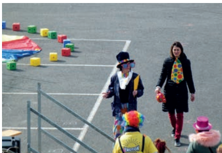
Derniers réglages coté artistes et coté organisateurs