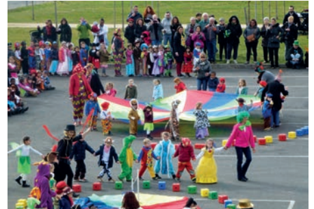
La parade des artistes