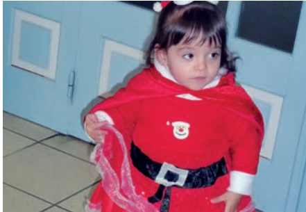
Déguisée mais pas encore à l'école

Les enfants des 4 écoles ont fait preuve de grande imagination non seulement dans le choix des déguisements que dans les plaisanteries du jugement de Monsieur Carnaval. La sentence a été approuvée par un public nombreux et très participatif, appréciant les arguments de la défense comme ceux de l'autorité judiciaire.