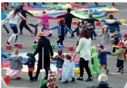
Enseignants, Animateurs du Centre de Loisirs, Encadrants, Bénévoles «maître d'œuvre»