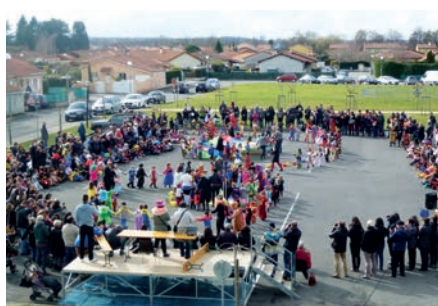
Les photographes sont en place pour immortaliser les moments forts