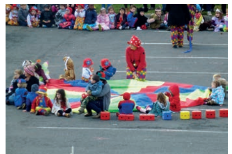
Le chapiteau est prêt