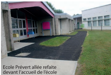
Ecole Prévert allée refaite devant l'accueil de l'école

Dans le cadre du prochain bon de commande, nous travaillerons sur la remise en état de certains fossés et chemins communaux qui ont été touchés par les épisodes orageux des mois de juin et juillet.