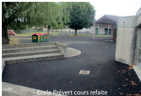
Ecole Prévert cours refaite