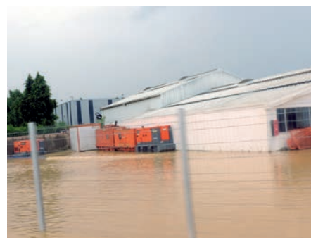
Route de Toulouse