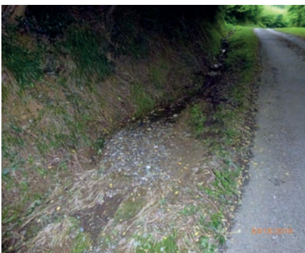
Avenue des sapins