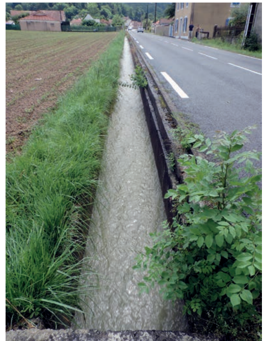
Avenue de la Libération