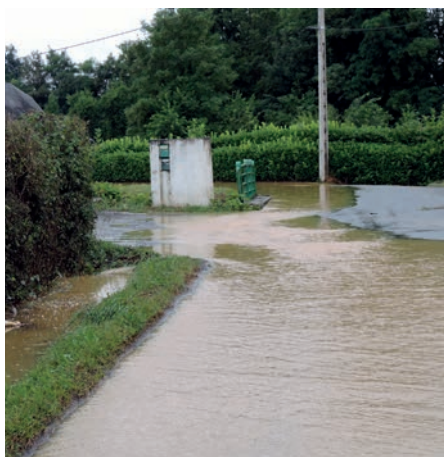
Rue de la Paix