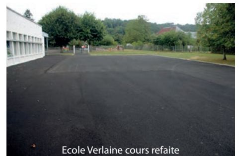
Ecole Verlaine cours refaite

Durant l'été les services techniques ont profité des vacances pour réaliser quelques travaux dans les écoles, afin que la rentrée scolaire s'effectue correctement et dans de bonnes conditions pour les élèves et les enseignants.