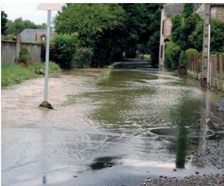
Rue des Anciens Combattants