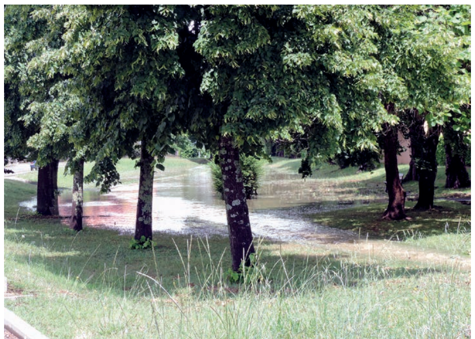
Bassin Loung Arriou