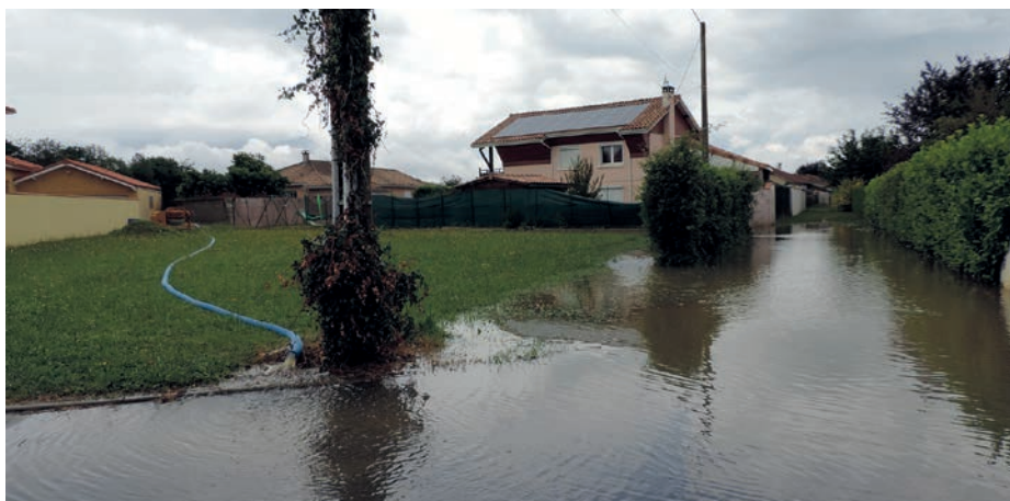
Rue de l'Egalité