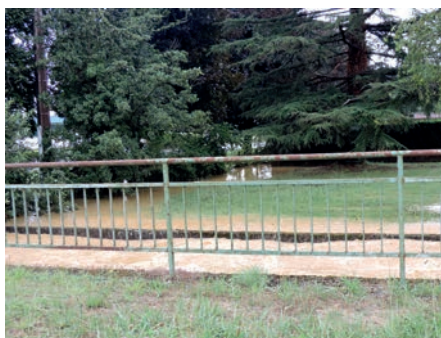
Route de Toulouse