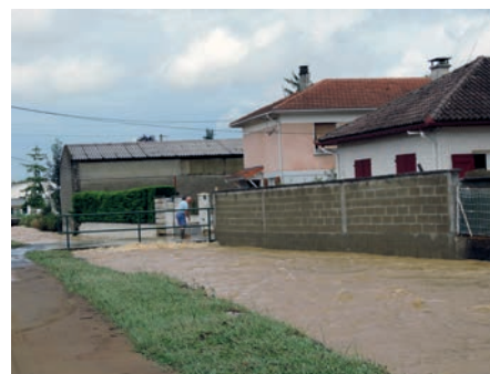
Rue de la Paix