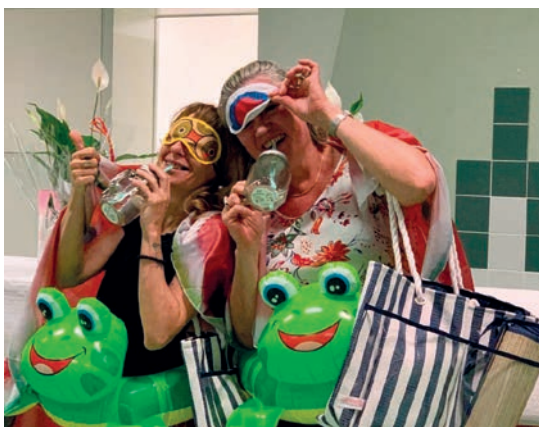
Nos animatrices préférées

Le timbre valait 0.32 €, le litre de super 0.78 €, la baguette 0.40 € et le SMIC mensuel était de 563 €.