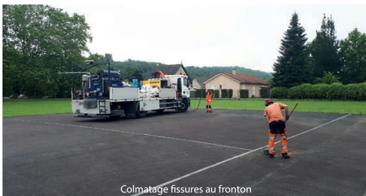
Colmatage fissures au fronton