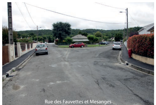
Rue des Fauvettes et Mesanges