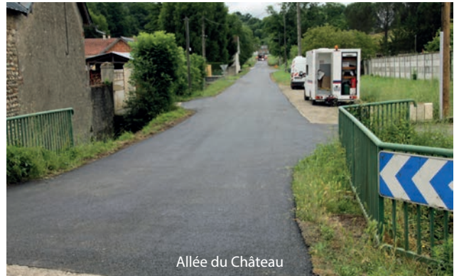
Allée du Château

Le diagnostic pour le renouvellement des chaudières du groupe scolaire Pagnol / Rimbaud et du gymnase est en cours. Elles devraient être remplacées avant le prochain hiver.