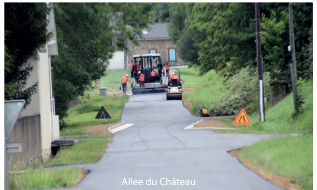
Allée du Château