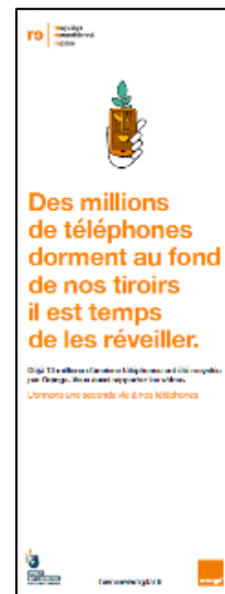
Kakemono 60X160 cm Générique