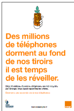
Affiche 40x60 cm Générique