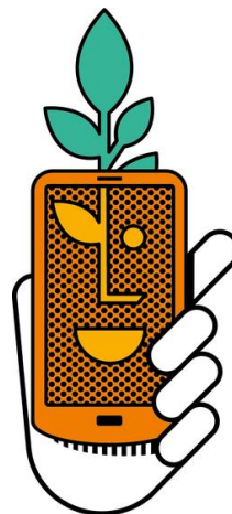
Visuel Clé Recyclage